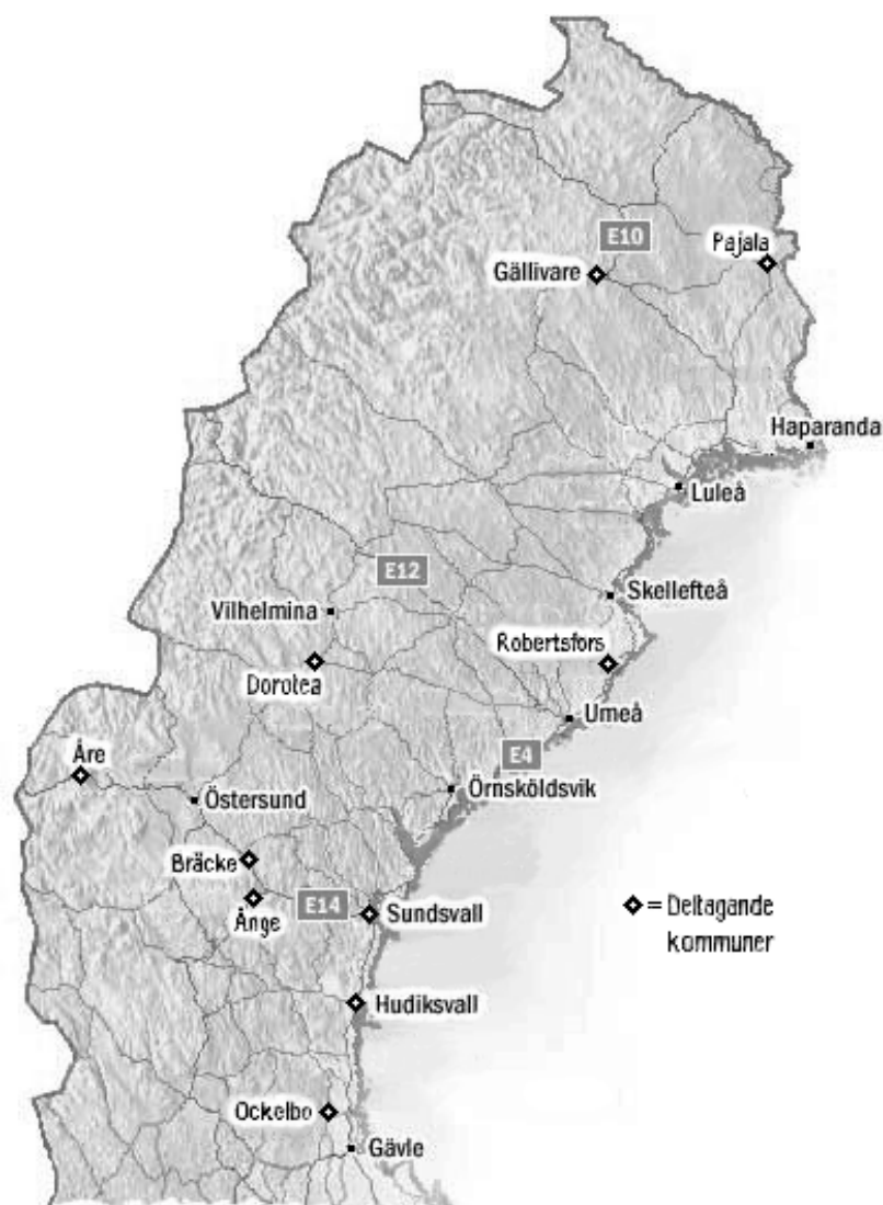
FIGUR 1: Karta över norra Sverige.

I Figur 1 är de medverkande kommunernas huvudorter utmärکتa, inklusive Åre. 70